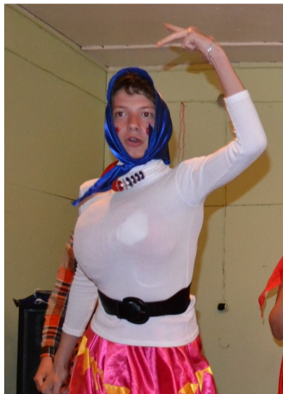
Вот такая Верка Сердючка по-медовски

P.S. Ждем на следующий год в лагерь «ПРОдвижение».