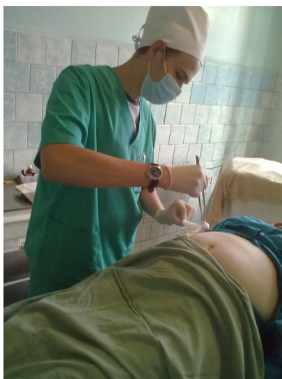
Мне удалось научиться многим премудростям ухода за больными