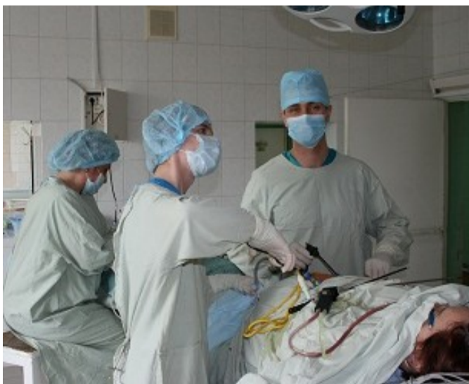
Хирургия - одна из самых экстремальных медицинских специальностей

Но без хирургов не представляет себя ни одна больница. Они вправляют вывихи, лечат переломы, удаляют опасные опухоли, вырезают аппендиксы, «по-королевски» принимают детей и выполняют ещё множество других важных операций. И результат их важнейшего труда всегда ощутим и понятен.